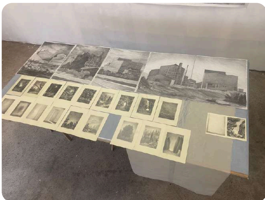
Atelier de Cédric Torne (dessins créés pour l'exposition)