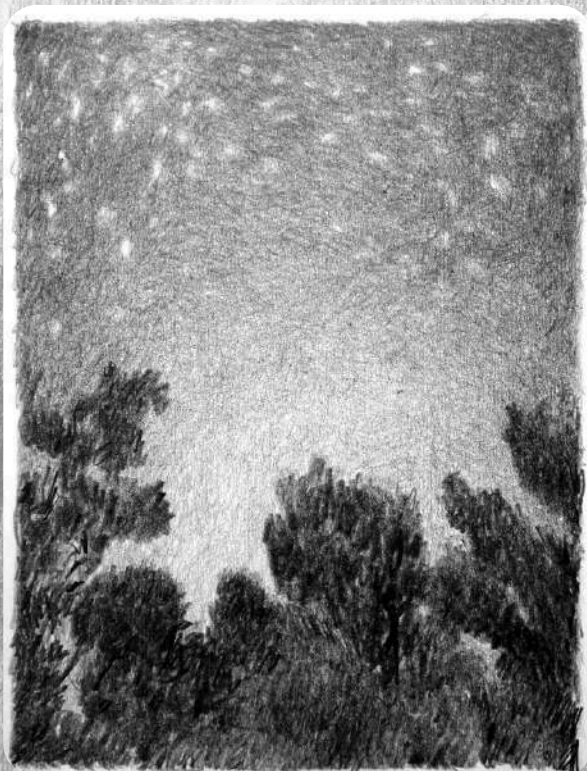
Brume (dessin au graphite, Cédric Torne)