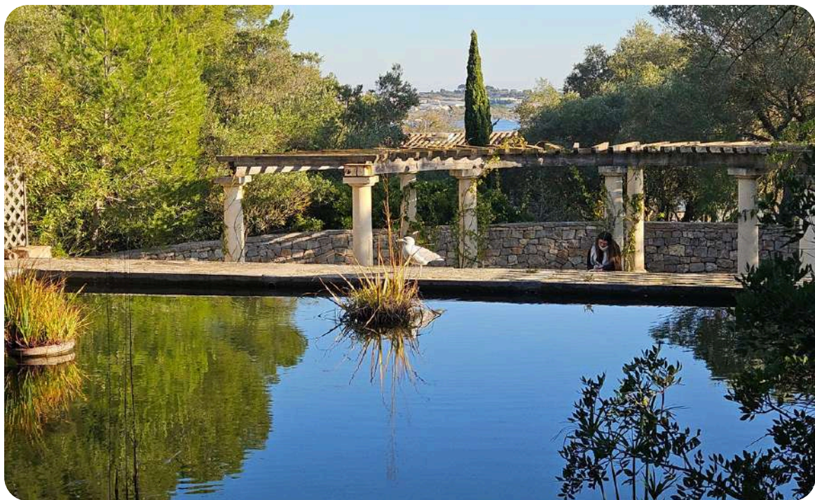
Apotheke (Jardin Antique Méditerranéen - Balaruc-les-Bains)

Techniques à l'encre et à la graphite sont déclinées autour du thème du paysage, du végétal, des sens. Les dessins présentés ont été dans leur quasi-totalité produits pour la présente exposition au Jardin Antique .