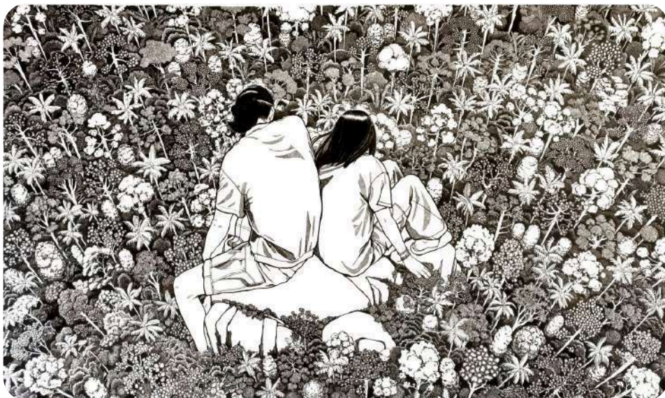
Canopée (dessin à l'encre, Hitomi Takeda)

Hitomi Takeda travaille à l'encre. Chez elle, la réserve — la part blanche de la feuille — occupe une place déterminante. Les espaces vides, loin d'être des absences, deviennent des forces actives de la composition, des respirations qui structurent le regard. La figure humaine, souvent déployée en proportions imposantes, n'y domine jamais la nature : elle s'y fond harmonieusement, en épouse les mouvements, partage sa vitalité. L'encre circule comme une sève, laissant affleurer le silence et la lumière du papier.