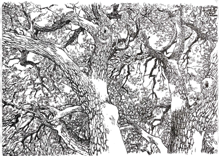
De la série " Des arbres" (dessin à l'encre, Hitomi Takeda)